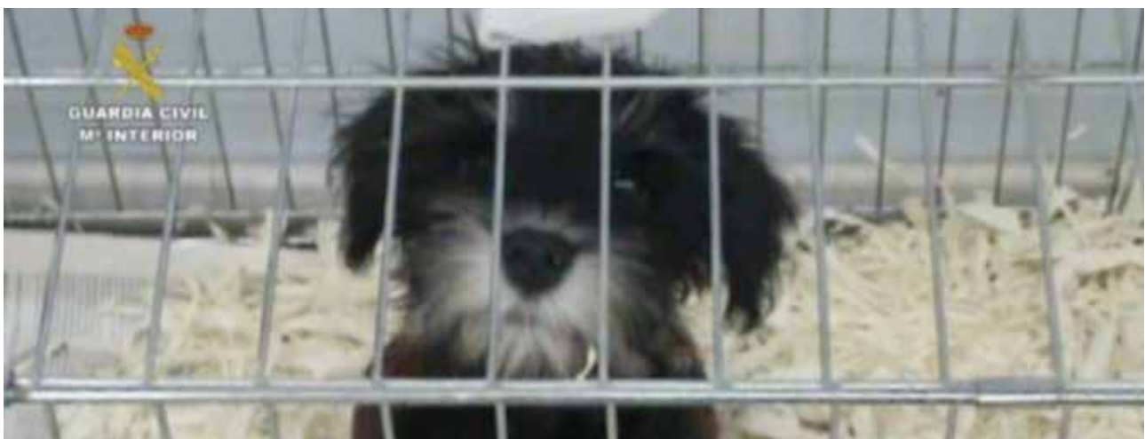
Uno de los cachorros intervenidos por la Guardia Civil.

Por eso, cuando se compra un animal importado es necesario obtener su pasaporte, donde poder comprobar que los números de microchip y la fecha de nacimiento coinciden con la cartilla sanitaria que acompaña al animal. Aunque desde ANDA recomendamos encarecidamente no comprar porque de manera indirecta estaríamos fomentado estas actividades.